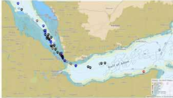
Fig 2 - 42 incidents have taken place in the Red Sea between 01 December 2023 and 18 January 2024