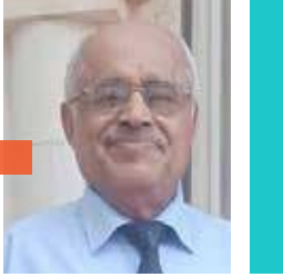
يكتبه: د. حسين الملعي