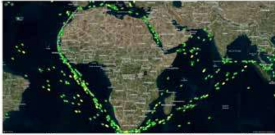
Fig 1 - Many ships are now routing around the Cape of Good Hope

شكل (3) حركة السفن التجارية بعد الهجمات الحوثية على السفن التجارية في البحر الاحمر